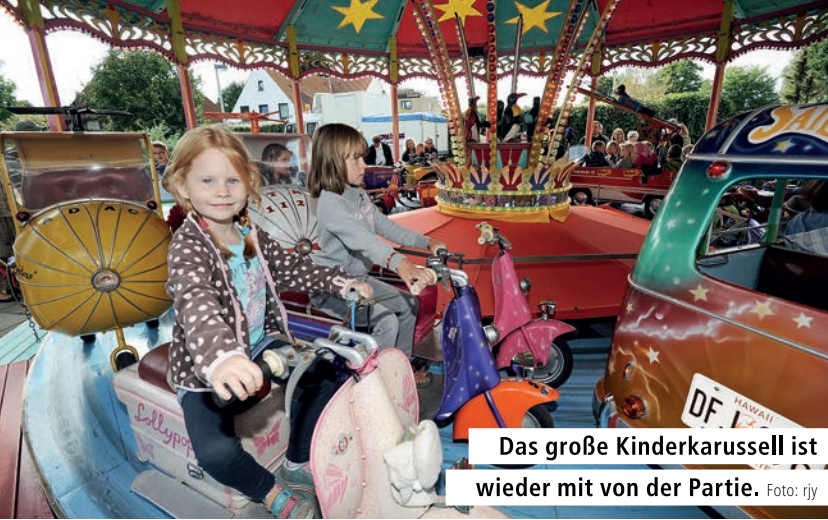
Das große Kinderkarussell ist wieder mit von der Partie.