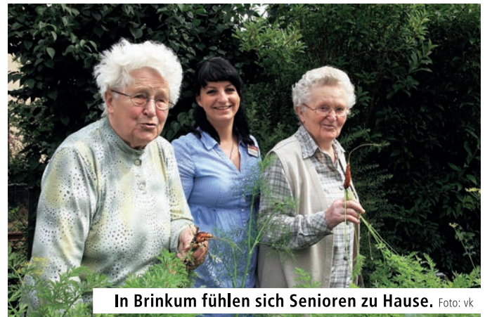
In Brinkum fühlen sich Senioren zu Hause.

Herzlichkeit, Geborgenheit und ein liebevolles Miteinander stehen im Mittelpunkt unserer attraktiven und ruhig gelegenen Senioren-Wohnanlage in Stuhr-Brinkum. Das Haupthaus verfügt über helle Einzel- und Doppelzimmer und bietet bis zu 80 Bewohnern Raum zum sorgenfreien Leben. Hinzu kommen bis zu 20 Plätze in den Pflegeappartements der direkt angrenzenden Wohnanlage, die 63 Quadratmeter groß sind. Sie eignen sich auch ideal für Ehepaare: Die gut geschnittene Zwei-Zimmer-Wohnung hat eine eigene kleine Küche und das Duschbad ist seniorengerecht ausgestattet. Eine großzügige Terrasse rundet das Angebot ab.