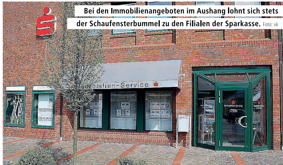
Bei den Immobilienangeboten im Aushang lohnt sich stets der Schaufensterbummel zu den Filialen der Sparkasse.

Vertrauen Sie auf fundiertes Fachwissen von Menschen aus der Region. Wir kennen uns hier vor Ort aus und helfen Ihnen, sich bei den vielen Fragen rund ums Wohnen zurechtzufinden und das Beste für sich herauszuholen. // vk