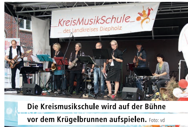
Die Kreismusikschule wird auf der Bühne vor dem Krügelbrunnen aufspielen.

„Das Angebot ist vielfältig und das Programm unterhaltsam – das beste jedoch sind die Besucher selbst“, hebt Schmidt hervor. Das Herbstfest ist ein Fest von Brinkumern für Brinkumer. „Hier trifft man sich und klönt, tauscht Neuigkeiten aus und schwelgt auch mal in vergangenen Tagen.“ So sei es auch der familiäre Charakter, der das Herbstfest und den Schweinemarkt so attraktiv machten. „Aber auch für auswärtige Gäste lohnt ein Besuch auf ganzer Linie“, betont der Marktmeister abschließend. // en